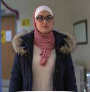
رم الشيباب مراجعة

"برنامج حكيم ساعدني في توفير الوقت من خلال تنظيم الإجراءات الداخلية وتسهيلها على المراجعين بدءاً من أخذ موعد مع الطبيب وحتى الحصول على الخدمة اللازمة. حيث أن عملية صرف الدواء من الصيدلية أصبحت أسرع وأسهل وأقل وقتاً"